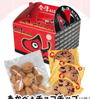
あかべえチョコチップ(1袋) &ごまみそせん(3枚) 12 594円