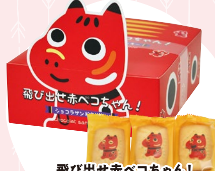
飛び出せ赤べこちゃん! ショコラサンドクッキー 14 (8入) 699円