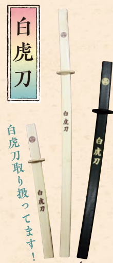
黒ぬりもあります。

木刀つて実は 会津が発祥の地なんです 修学旅行みやげの定番として知られる木刀は 実は会津若松市のタハリシ産業が 約五十年前に各地へ売り込んだことで 全国へ広まりました。 今も昔も変わらない 人気商品です。 (45cm) 715円 (60cm) 935円 (90cm) 1,595円 (黒60cm) 1,375円