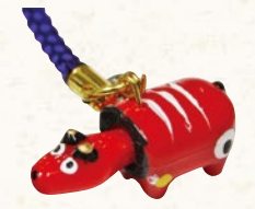
24 赤べこ根付 315円