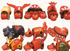
神獣べこ(ガチャガチャ) (1回) 300円~