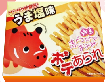
赤べこポテあられ 9 (2入) 540円