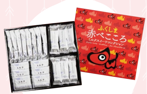
赤べこスイーツコレクション 8 (20入) 1,250円