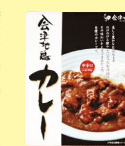
33 会津地鶏カレー (中辛) 783円