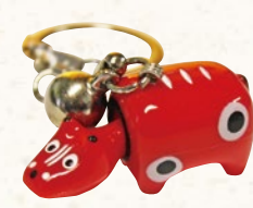
23 赤べこキーホルダー 297円