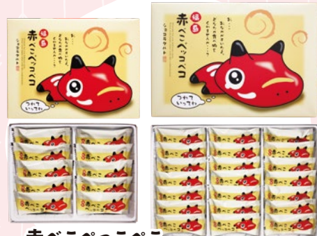
赤べこぺっこぺこ 10 (10入) 594円 11 (21入) 1,026円