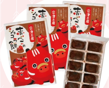
赤べこのショコラ餅 17 (3箱) 712円