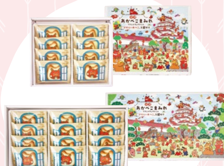
あかべこまみれ 20 (8入) 845円 21 (12入) 1,200円