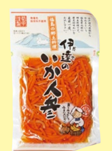
35 いかにんじん 486円