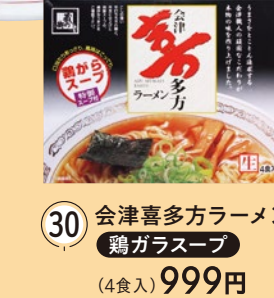
30 会津喜多方ラーメン 鶏ガラスープ (4食入) 999円