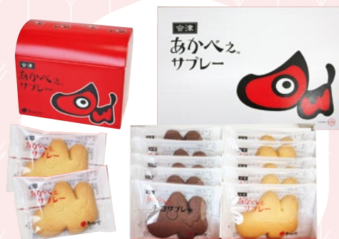
あかべえサブレ 18 (6入) 513円 19 (10入) 864円