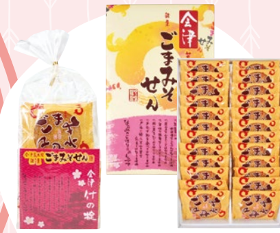
ごまみそせん 1 (15入) 858円 2 (24入) 1,499円