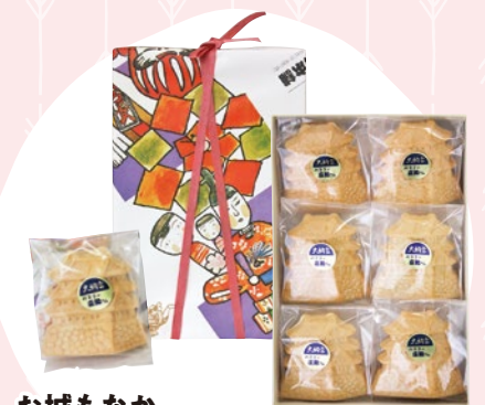
お城もなか 15 (1コ) 259円 16 (6入) 1,512円