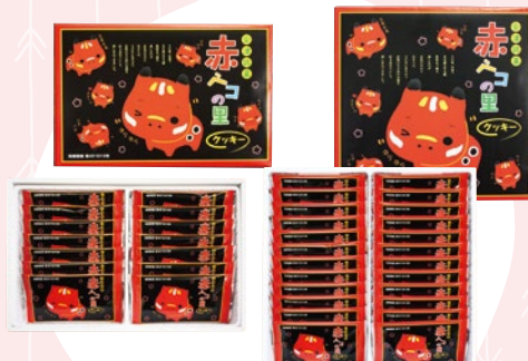
赤べこの里クッキー 3 (14入) 669円 4 (24入) 1,117円