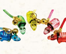
25 赤べこクリア根付 315円