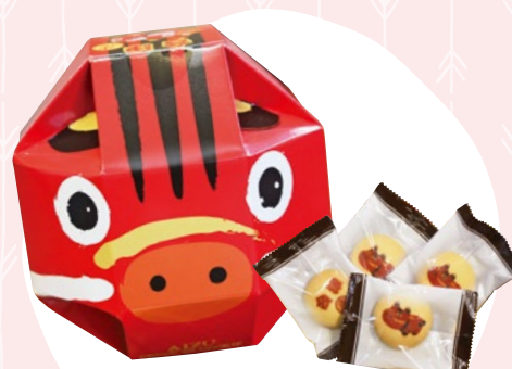
赤べこチョコインクッキー 13 (10入) 702円