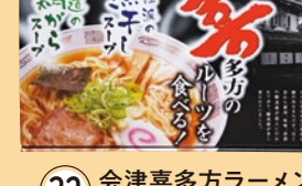
32 会津喜多方ラーメン 煮干&鶏ガラスープ (6食入) 1,350円