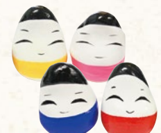
22 起き上がり小法師 (小) 220円