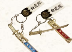
28 白虎刀キーホルダー 495円