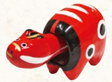
26 赤べこ (No.2) 2,090円