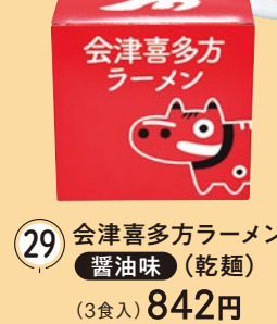
29 会津喜多方ラーメン 醤油味(乾麺) (3食入) 842円