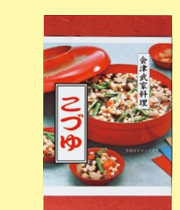
34 こぶゆ 669円