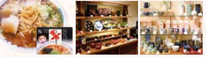
【喜多方ラーメン】 【工艺品】会津漆器・会津本郷焼

ふくしまの 酒蔵が 勢ぞろい! 地酒 ふくしまの豊かな自然に育まれ、おいしい水とお米が香り豊かな地酒を生み出す。個性豊かな蔵本の銘酒を一同に揃えました。